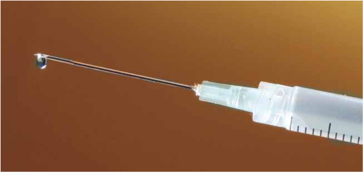
Los expertos siguen buscando una vacuna que controle el virus.

Filipinas, Tailandia, Vietnam e Indonesia. Continuando con la trayectoria del Zika, informes científicos evidenciaron que en 14 países a lo largo de África, Asia y Oceanía presentaron la detección del Zika en mosquitos, primates y humanos.