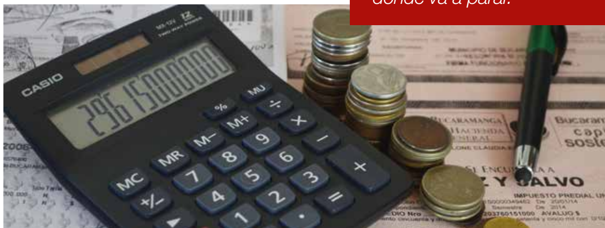
Para el año 2015 se recaudaron 29 mil 615 millones de pesos en el impuesto al valor agregado (IVA), según cifras de la Subdirección de Gestión de Análisis Operacional de la Dian.

La mayoría de los colombianos es consciente de que gasta una cantidad considerable de dinero en impuestos, sin embargo, muy pocos saben realmente en qué momento es que se les escapa esta 'platica' del bolsillo, y mucho menos a dónde va a parar.