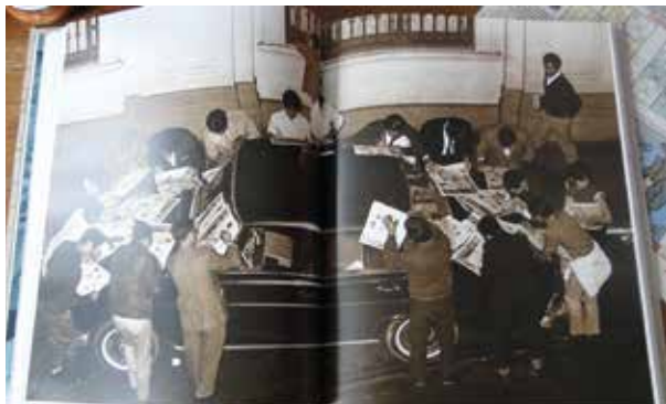
El Crucigrama millonario fue expuesto en el Congreso Nacional de Honduras, como una estrategia de mercadeo. Aunque se dudaba de su éxito, logró un aumento en la venta de periódicos llegando a 95 mil ejemplares.