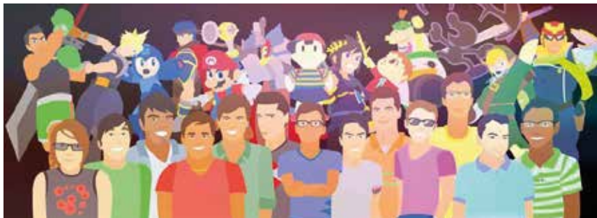
Esta es una caricatura del equipo de Smash Bucaramanga, conformado por 13 integrantes que entrenan cuatro veces a la semana durante tres horas.

No toda persona que juegue un videojuego es considerado un gamer, pues no solamente se necesita vocación, también pasión.