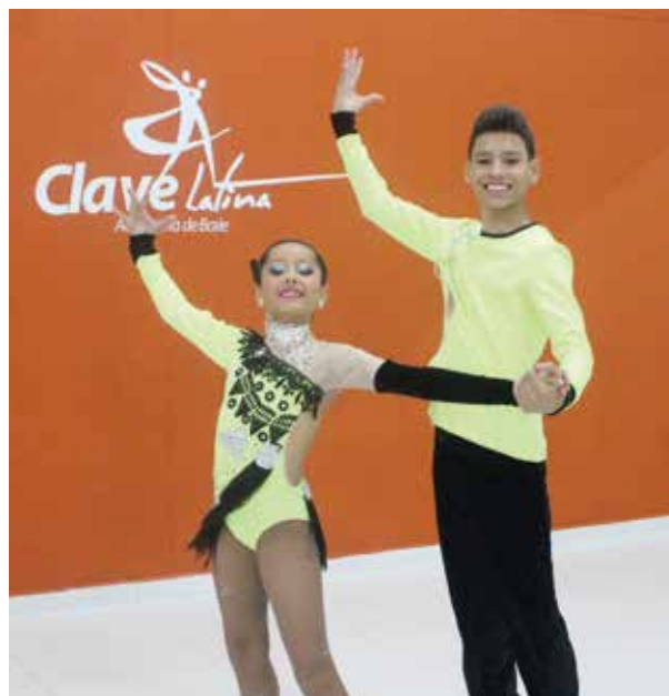
Con tan sólo once y doce años estos niños bailan como profesionales.