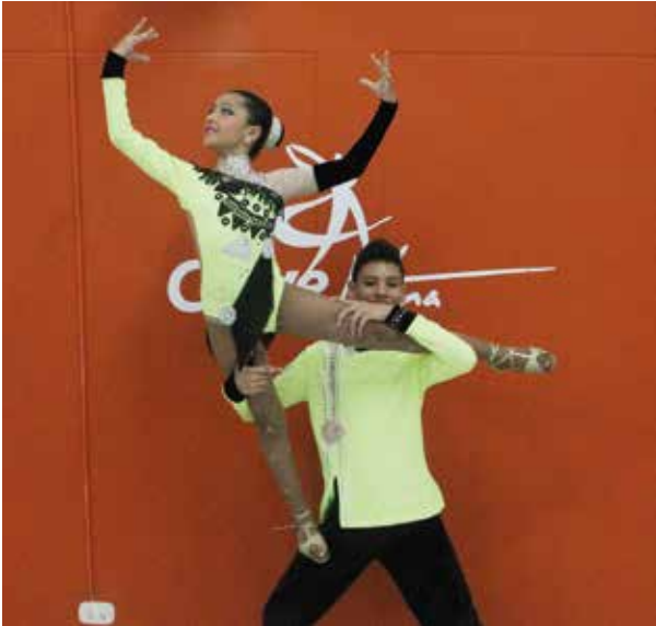
El grupo profesional infantil de Clave Latina es actual subcampeón mundial del World Latin Dance Cup, competencia que se realiza cada año en Miami-Estados Unidos.

Ya con la experiencia del concurso Bailando por un sueño, seis años después, en 2012, Diego Valbuena se presentó a un concurso similar, Colombia tiene talento. “Pasamos varias rondas pero sufrimos una caída realizando las acrobacias. Por eso no llegamos a las semifinales. Después del programa mucha gente quiso vincularse a nuestra academia y aprender”, cuenta el director.