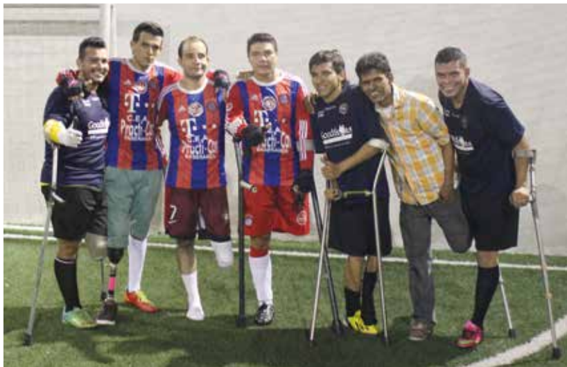
Muchas personas en condición de discapacidad buscan en el deporte no solo una oportunidad para mantenerse en forma sino para compartir con otros colegas y demostrar su talento.

formándose. Esta Universidad, la pública más grande del oriente colombiano, desarrolla un programa de inclusión que guía a los estudiantes en situación de discapacidad, brindándoles acompañamiento, atención, asesorías y apoyo.