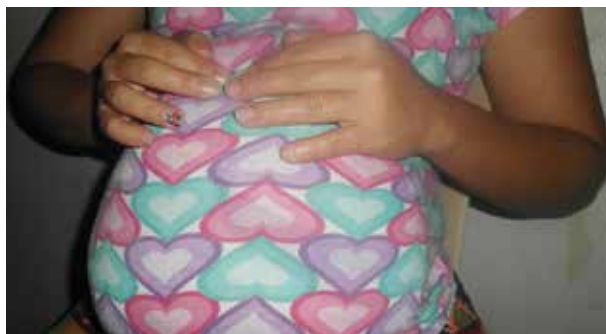
Los estudios científicos han encontrado que el Zika genera microcefalia en los fetos. Un reciente estudio arrojó que el virus sólo afecta al bebé en gestación durante las primeras semanas en que se está formando.

Aunque por múltiples medios el gobierno les pide a los ciudadanos que consulten a sus respectivos médicos una vez sientan dolor de cabeza, noten un sarpullido en el cuerpo, presenten fiebre, ojos irritados y dolor en las articulaciones, en la práctica muchos de