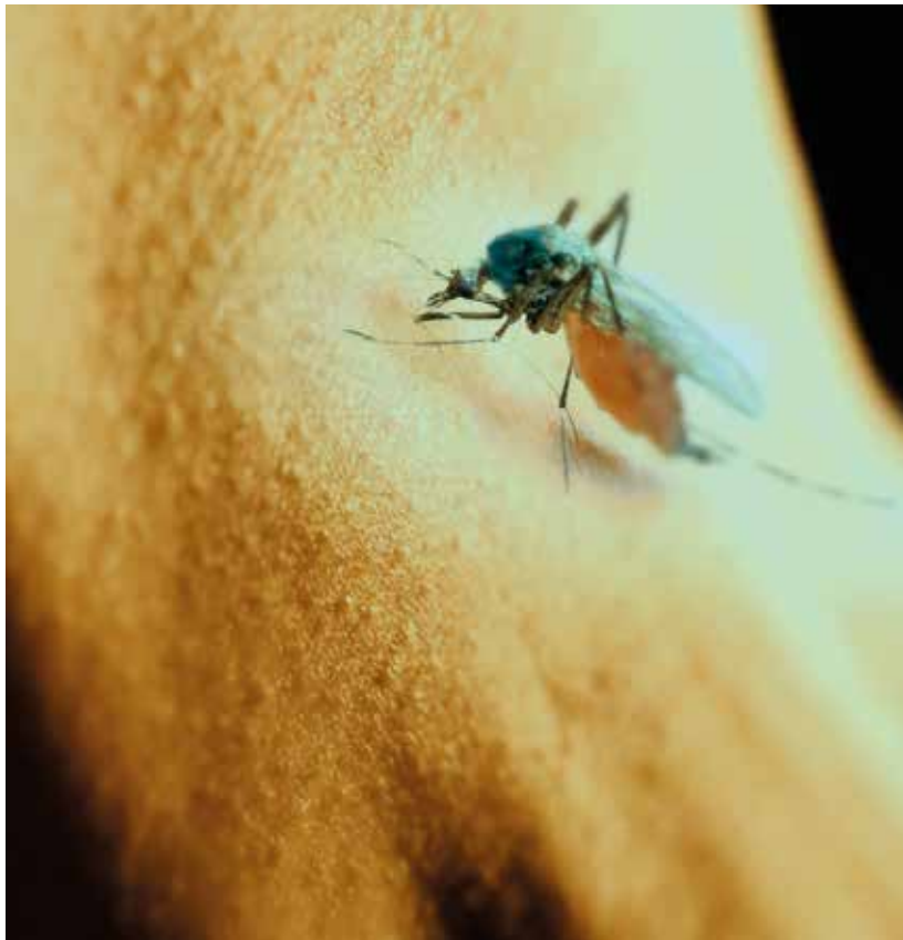
Santander es un reservorio de zancudos, ya que sus temperaturas cálidas están por encima de los 27 y 28 grados centígrados.

Aunque las alarmas por el virus del Zika ya disminuyeron, todavía persisten casos de personas que padecen la enfermedad en la ciudad y el área metropolitana. La educación en estos temas es importante para la prevención y los cuidados.