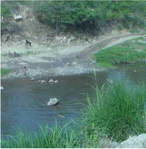
El Río de Oro es uno de los más contaminados de la ciudad y el área metropolitana. Habitantes de Girón, Zapatoca, Nuevo Girón y Llano Grande son los más afectados por la contaminación. Allí las autoridades de salud han reportado brotes de varicela, afecciones en la piel y enfermedades respiratorias.

boletines de prensa la Corporación Autónoma Regional para la Defensa de la Meseta de Bucaramanga (CdmB) indicó que el fenómeno no tardaría y sugería a los ciudadanos un mejor manejo del recurso hídrico, Puente Brugés reiteró: “el problema no es solamente El Niño”.