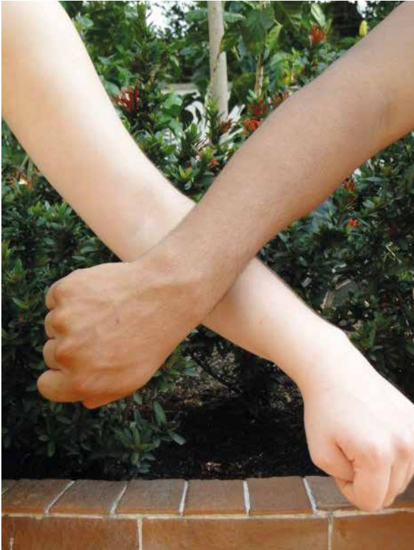
Aunque las Leyes colombianas e internacionales ordenan la igualdad sin distinción de raza; en la realidad ocurre lo contrario.

Simón Bolívar o Francisco de Paula Santander, Nieto no ha sido exaltado en la historia colombiana, pese a que logró llegar al poder por votación popular.