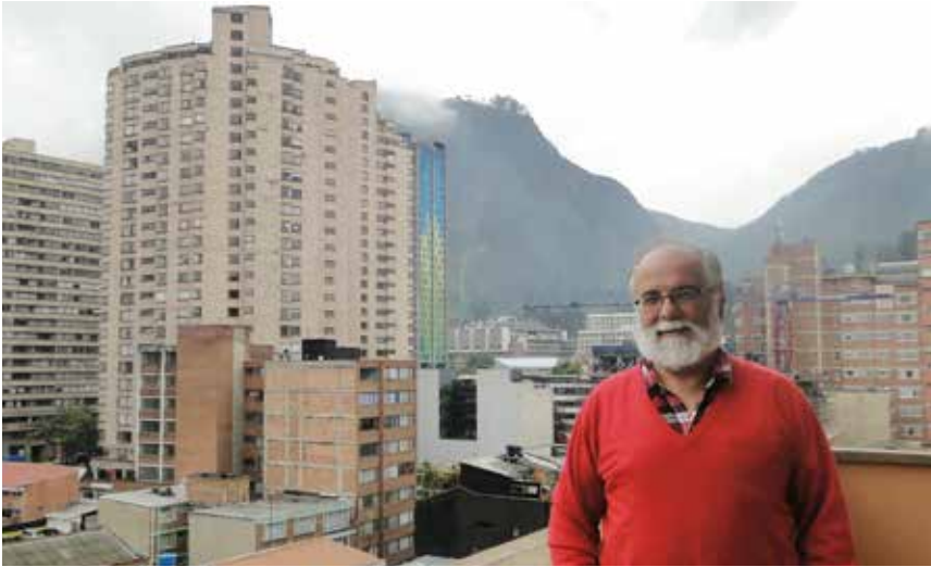
Para muchos colombianos, un buen periódico es el que tiene crucigrama. Si no lo tiene, no se toma como tal.

la misma habilidad, es artífice de los acertijos publicados en El Heraldillo y Al Día, los diarios locales de Barranquilla. Sus tres hijos son también cómplices en la formulación de preguntas y respuestas.