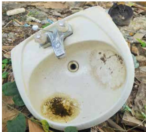
La ciudadanía en general no es consciente del uso racional del agua. Cuando escasea o cuando el gobierno anuncia medidas drásticas, es que muchos reconocen la importancia de hacer un uso eficiente.

En Colombia en el año 2013 por medio de la sentencia T-154 la Corte Constitucional analizó