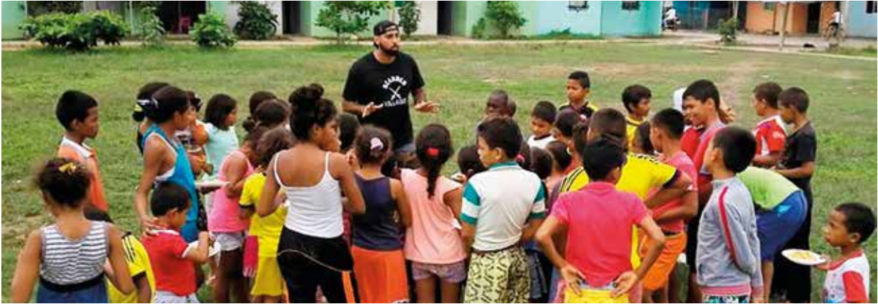
El capitán de cada capítulo tiene acceso a un chat en el que están los demás capitanes y co-capitanes del mundo, incluido el fundador. En ese chat comparten información sobre actividades y cambios en la hermandad.