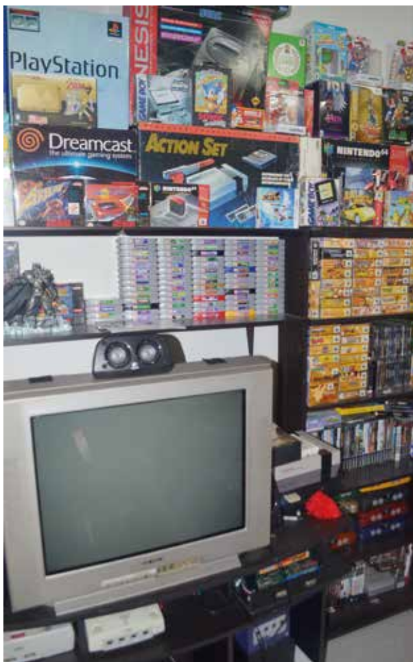
En las cuentas de “Dark Serge”, como es conocido en el mundo de los aficionados por los videojuegos, hay exactamente 500 videojuegos y 50 consolas de diferentes marcas las cuales están distribuidas por todas partes de su habitación.

Comenzó a jugar desde las consolas de videojuegos más antiguas hasta las más recientes. Es decir, pasó por el Atari 1600 , Family , NES , Super NES , Creation , Nintendo 64 , Playstation , Playstation 2 , Game Cube , Xbox , Wii , Xbox 360 , Playstation 3 , hasta las actuales consolas que son Xbox One , Playstation 4 y Wii U . Todas hacen parte de su colección en el cuarto.