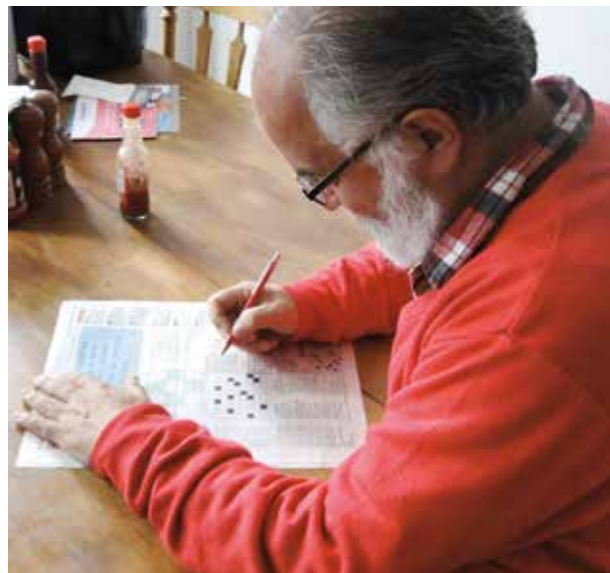
El juego Scrabble tiene su origen del crucigrama.

En Colombia no existe la cultura de resolver crucigramas, porque la cultura no es saber contestar preguntas, ni saber datos. Pero sí está en ella el solucionar este tipo de pasatiempos. El poner a una persona a pensar, acordarse de pequeñas cosas y en pasar un agradable momento. "Este es el fin de un crucigrama", concluye Rivas mientras se alista frente a su escritorio, toma un diccionario, enciende el computador y comienza a cruzar las palabras que pondrán a pensar a más lectores.