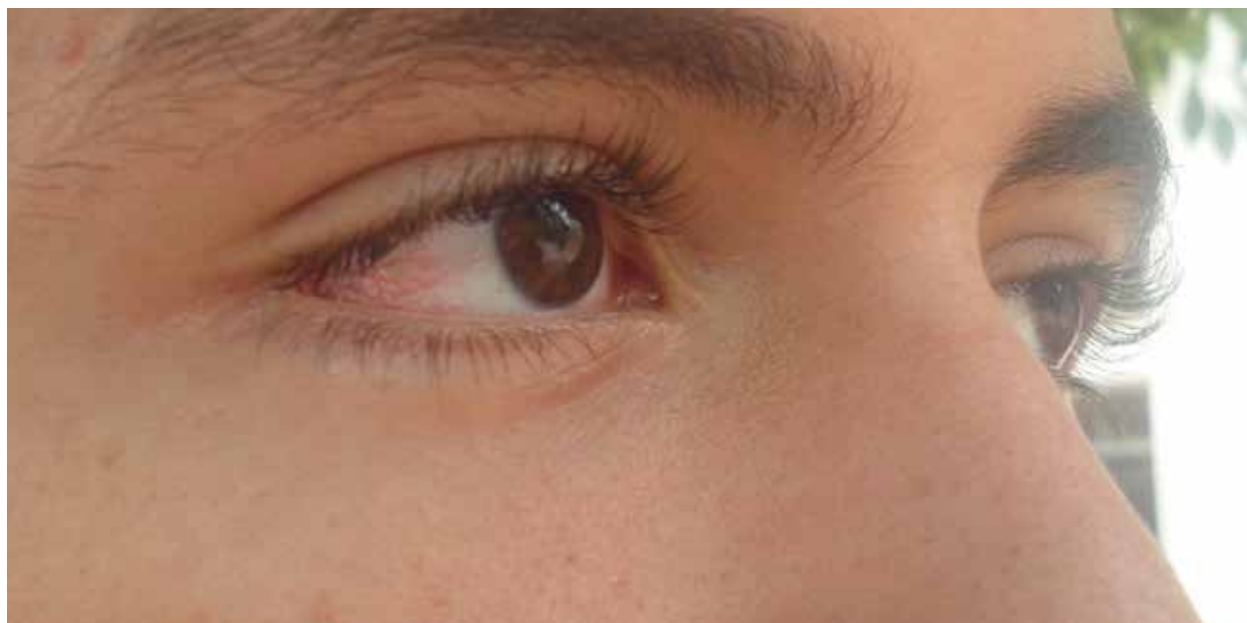
El virus del Zika genera en el ser humano enrojecimiento de los ojos, dolor de cabeza, fiebre, sarpullido y dolor en las articulaciones.

Entre 1951 y 1981, investigadores hallaron evidencia serológica de humanos infectados en países africanos como Uganda, Tanzania, Egipto, África Central, República, Sierra Leona y Gabón, y en algunas partes de Asia, incluyendo India, Malasia, ►