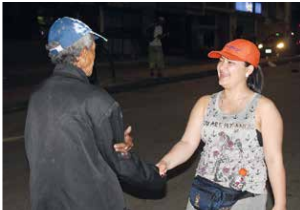
En la capital santandereana hay por lo menos mil habitantes de calle según datos oficiales. El Aguapanelazo Colombia es una iniciativa de voluntarios que les lleva alimento cada semana.

Esta obra social es una apuesta por brindarles afecto y algo de alimento a los habitantes de calle de varias ciudades del país. En Bucaramanga, cada semana un grupo de voluntarios reparte agua de panela y pan en la Avenida Quebradaseca y la carrera 15.