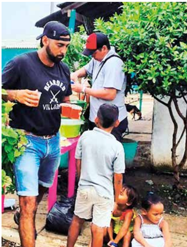
La barba es el requisito principal para pertenecer a Bearded Villains. Los integrantes explican que ésta debe tener por lo menos dos pulgadas de extensión, cosa que las hace abundantes.

Aunque la sociedad ha catalogado a la comunidad de los ‘villanos’ barbados como un mainstream , es decir, un estilo de vida alternativo predominante en la actualidad, ellos consideran que Bearded Villains es un movimiento dispuesto a corregir la imagen sobre los hombres con barbas. A pesar del nombre, los ‘villanos’ barbados insisten en que son buenos hombres, que han apostado por las campañas y obras de caridad para construir un mundo mejor. Esta idea que inició como una simple página web para el cuidado de la barba, hoy es una pequeña revolución en el prototipo de masculinidad porque han creado lazos entre ellos hasta llamarse hermanos.