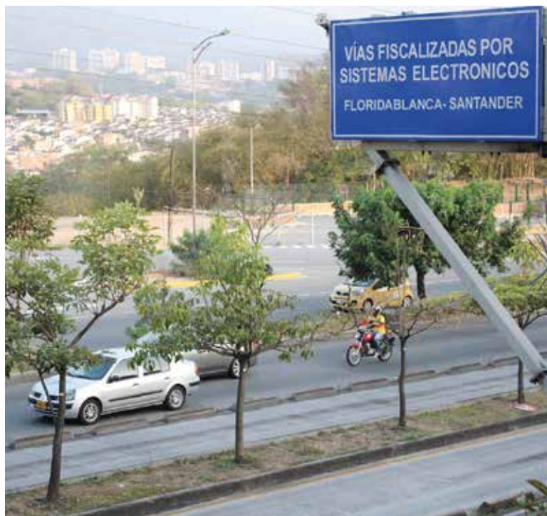
Sistemas de detección electrónicos instalados en la paralela El Bosque en sentido norte-sur.

Desde hace cuatro años la Alcaldía de Floridablanca implementó las 'foto-multas' en este municipio, una decisión que generó controversia en la comunidad, por la mala ejecución en los procedimientos de los comparendos y por las irregularidades de las multas injustificadas.