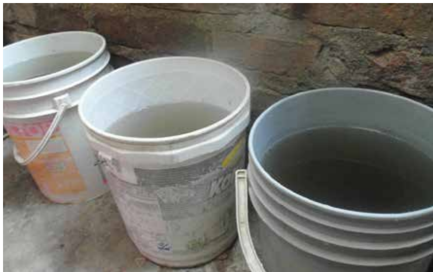
Las aguas estancadas son potenciales criaderos de zancudos. Las campañas de prevención reiteran la importancia de eliminar esos reservorios.

La Secretaría de Salud Departamental ha hecho campañas de prevención para impedir que en las casas o barrios se formen criaderos de zancudos, informando que es necesario evitar mantener aguas estancadas en recipientes y realizar una limpieza semanal en los tanques de los lavaderos. “Exterminar a los zancudos no es solo fumigar, también se requiere que la comunidad tome conciencia de la limpieza