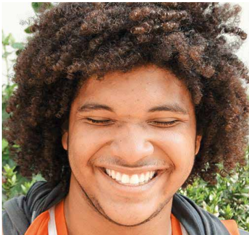
La Constitución Política de 1991 fue la primera en reconocer la diversidad cultural de Colombia.

En Santander, la raza sigue siendo un motivo de discriminación. Plataforma encontró que son muchos los casos en los que se señala, maltrata y excluye a la población afrodescendiente simplemente por su color de piel. Pese a que la Ley colombiana promueve la igualdad, el racismo es un problema que se vive a diario.